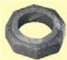
Isokern suitsusiiber, saadaval läbimõõtudele Ø13, Ø16, Ø18 ja 20 cm