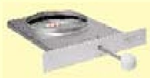
Nõgiluuk / malm / Rondo Plus & EM Nõgiluugi liiteelement / Rondo Plus & EM