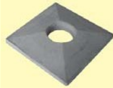
Isokern konsool kivivoodrile, saadaval läbimõõtudele Ø13, Ø16, Ø18 ja 20 cm