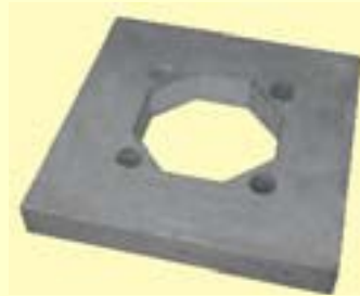
Isokern konsoolühendus, saadaval läbimõõtudele Ø13, Ø16, Ø18 ja 20 cm